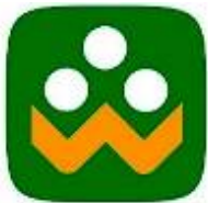
شبکه آموزش دانش آموزی منطبق به وزارت آموزش و پرورش