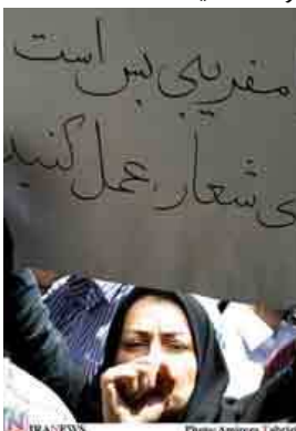
مفردی پس است شعار عمل کنید IRAN NEWS Photo: Amrooz Talabiz