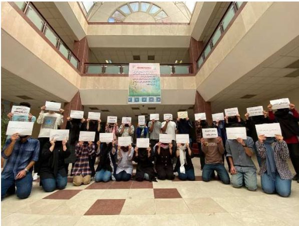
یکشنبه ۲۰ آذر: