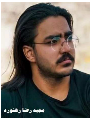
مجید رضا رهنورد

شهروندانی که در صدد شرکت در مراسم گرامیداشت زنده یاد مجیدرضا رهنورد در مشهد بودند با در بسته مسجد روبرو شدند. شهید قهرمان مجید رضا رهنورد تنها سه هفته پس از بازداشت، در حالی که تحت اعترافات اجباری قرار گرفته بود، به اتهام «کشتن دو بسیجی» اعدام شد. اجرای این حکم موجی از خشم و انزجار در داخل و خارج ایران برانگیخت. در شبکه های اجتماعی تصاویری از منزل مسکونی خانواده مجیدرضا رهنورد در خیابان حر عاملی، مشهد منتشر شده است که نشان می دهد پنجره‌های خانه وی شکسته شده